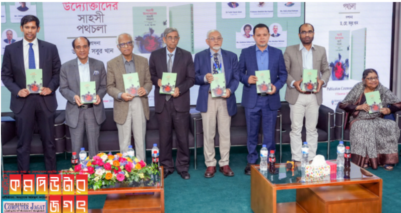
'সংগ্রামী উদ্যোক্তাদের সাহসী পথচলা' বইয়ের মোড়ক উন্মোচন