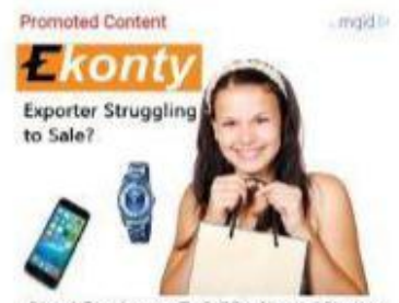
Open A Free Account To Sell Produts And Services