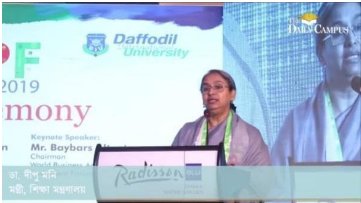
Covering an event of Education Minister Dipu Moni