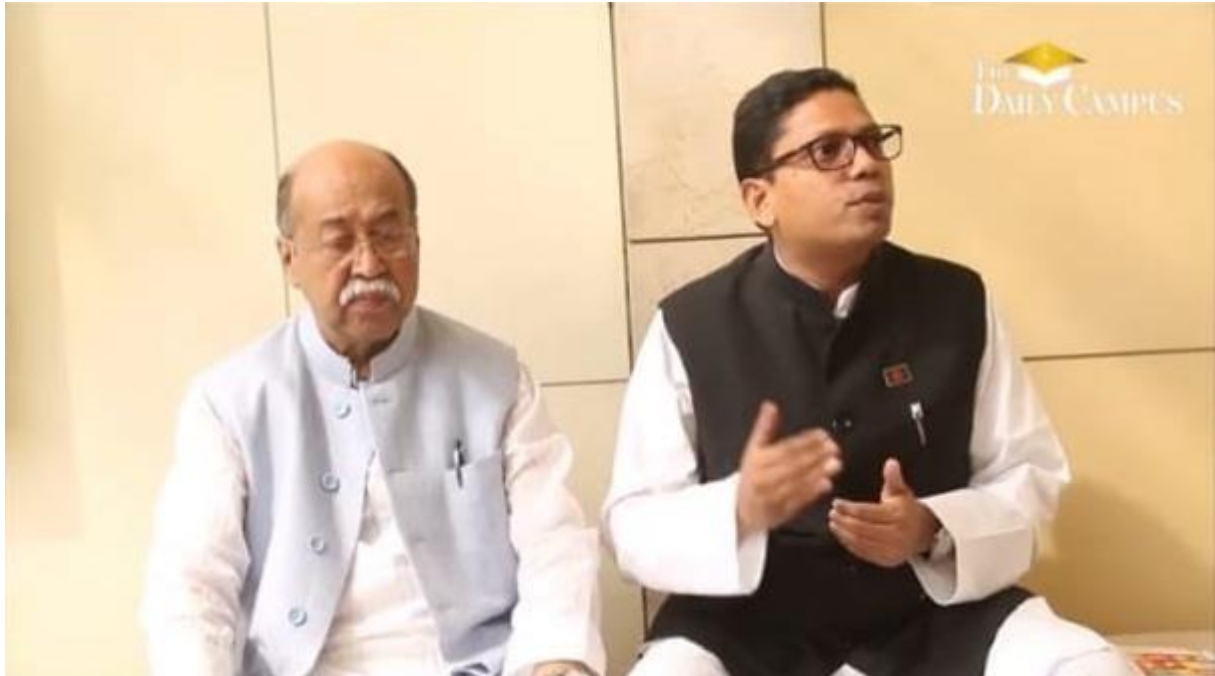
Taking the interview of Industrial Minister Nurul Majid Mahmud Humayun and ICT Minister Zunaid Ahmed Palak