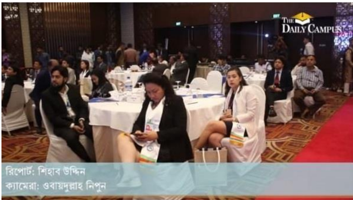
Covering Event of Asian University president Forum (AUPF)