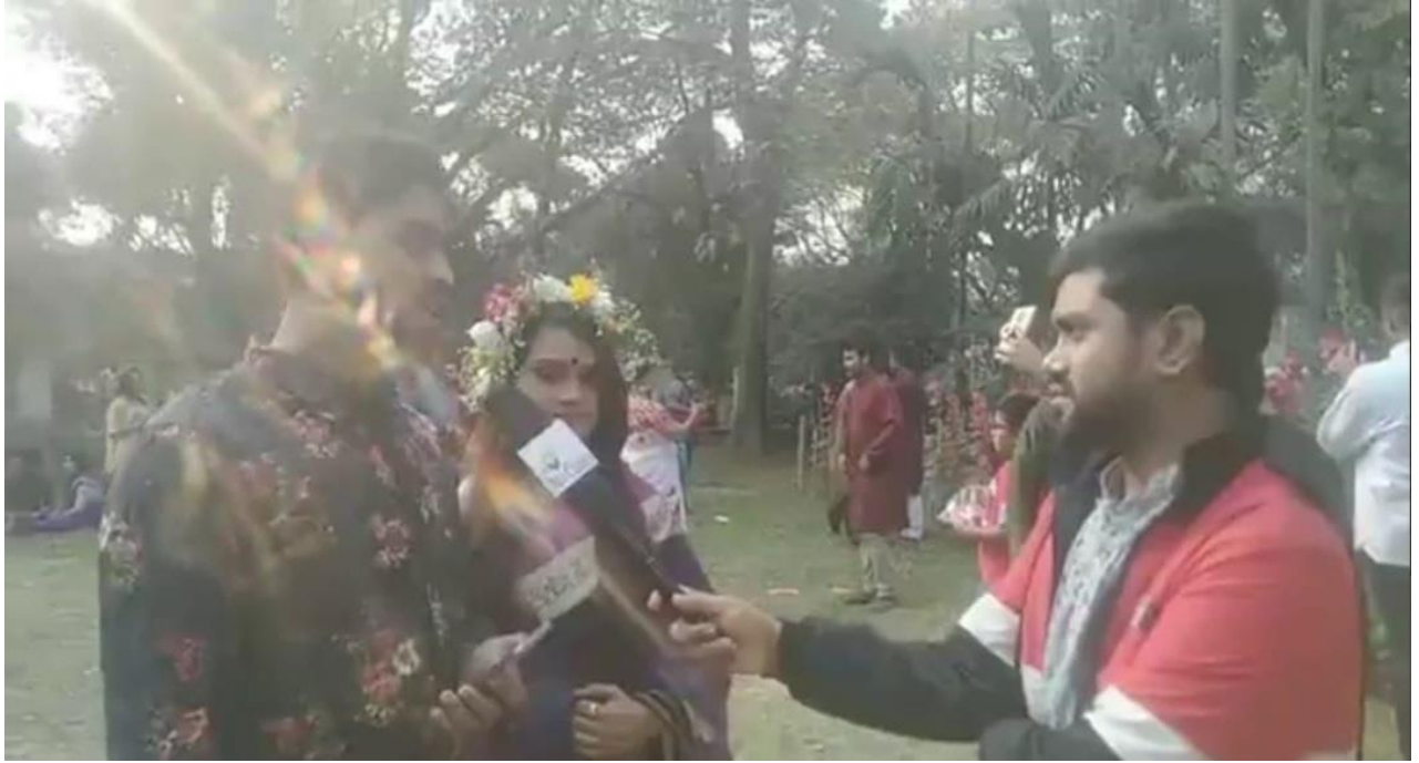
Taking Interview of Mass people During the occasion of Ekushe Book Fair