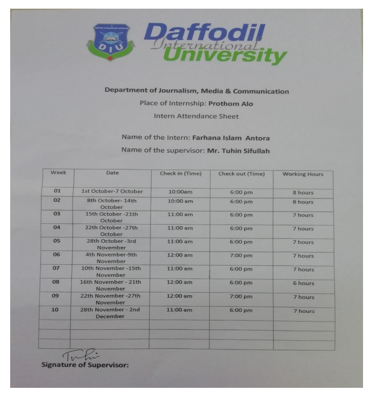
Fig-03: Intern Attendance sheet

I used to go to Prothom alo office at 10.00 am & work under the guidance of my supervisor & seniors. I need to work there more or less 8 hours daily.