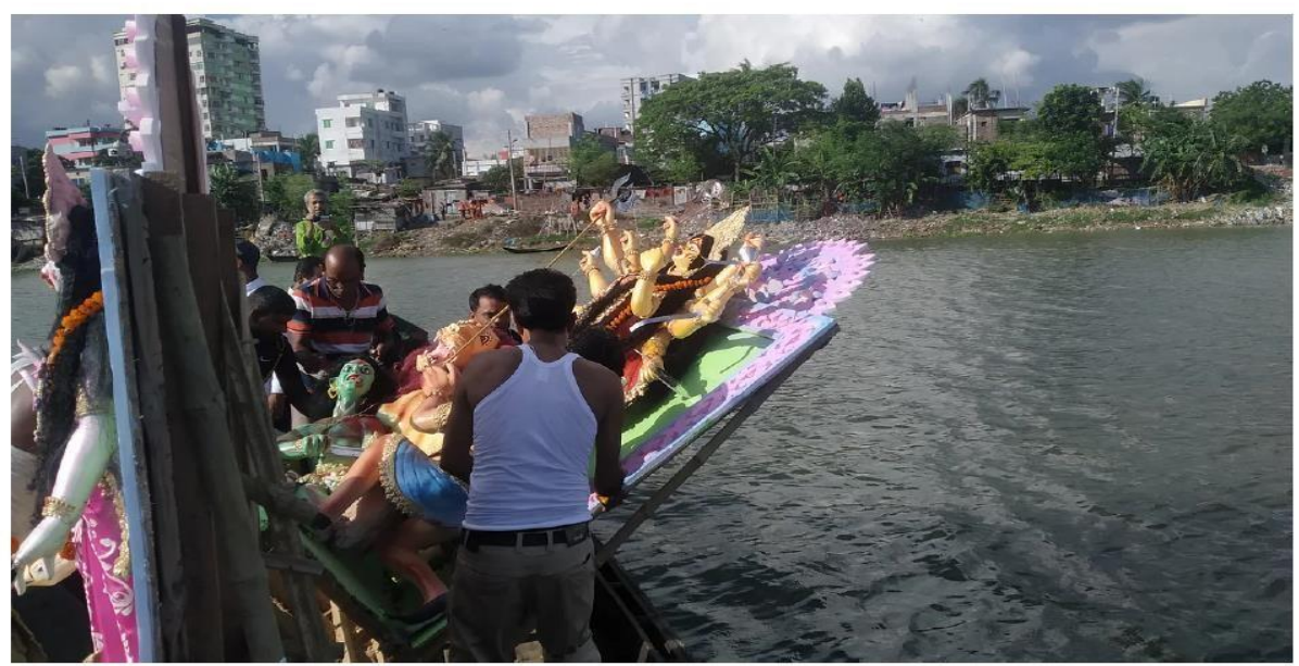
দুর্গাপূজা শেষে রাজশাহীর পদ্মা নদীতে প্রতিমা বিসর্জন দেওয়া হচ্ছে। আজ বুধবার বিকেলে রাজশাহী নগরের ফুদকিপাড়া পদ্মা নদী এলাকায়

দেবীর বিসর্জনের মধ্য দিয়ে আজ শেষ হচ্ছে শারদীয় দুর্গোৎসব। রাজশাহীতে প্রতিমা বিসর্জনও শুরু হয়েছে। আজ বুধবার দুপুরে নগরের ফুদকিপাড়া এলাকায় মুন্নুজান সরকারি প্রাথমিক বিদ্যালয়ের সামনে পদ্মা নদীতে শুরু হয় প্রতিমা বিসর্জন। তবে বেশির ভাগ প্রতিমা বিসর্জন শুরু হয় বিকেলের পর থেকে।