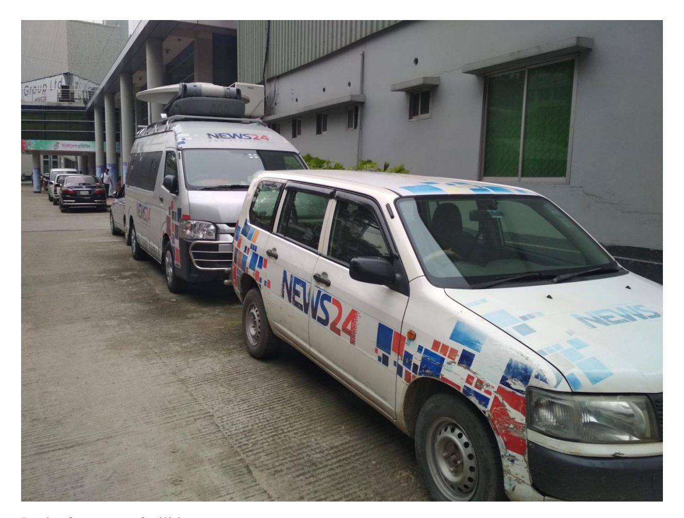
Lack of transport facilities