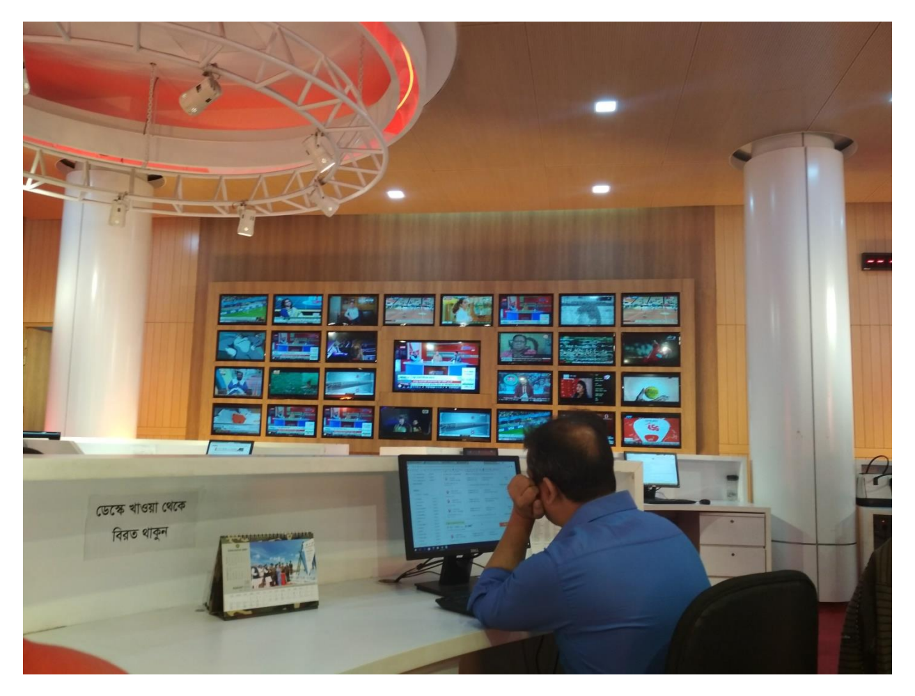
Better working environment