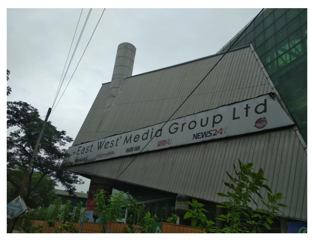
East West Media Group