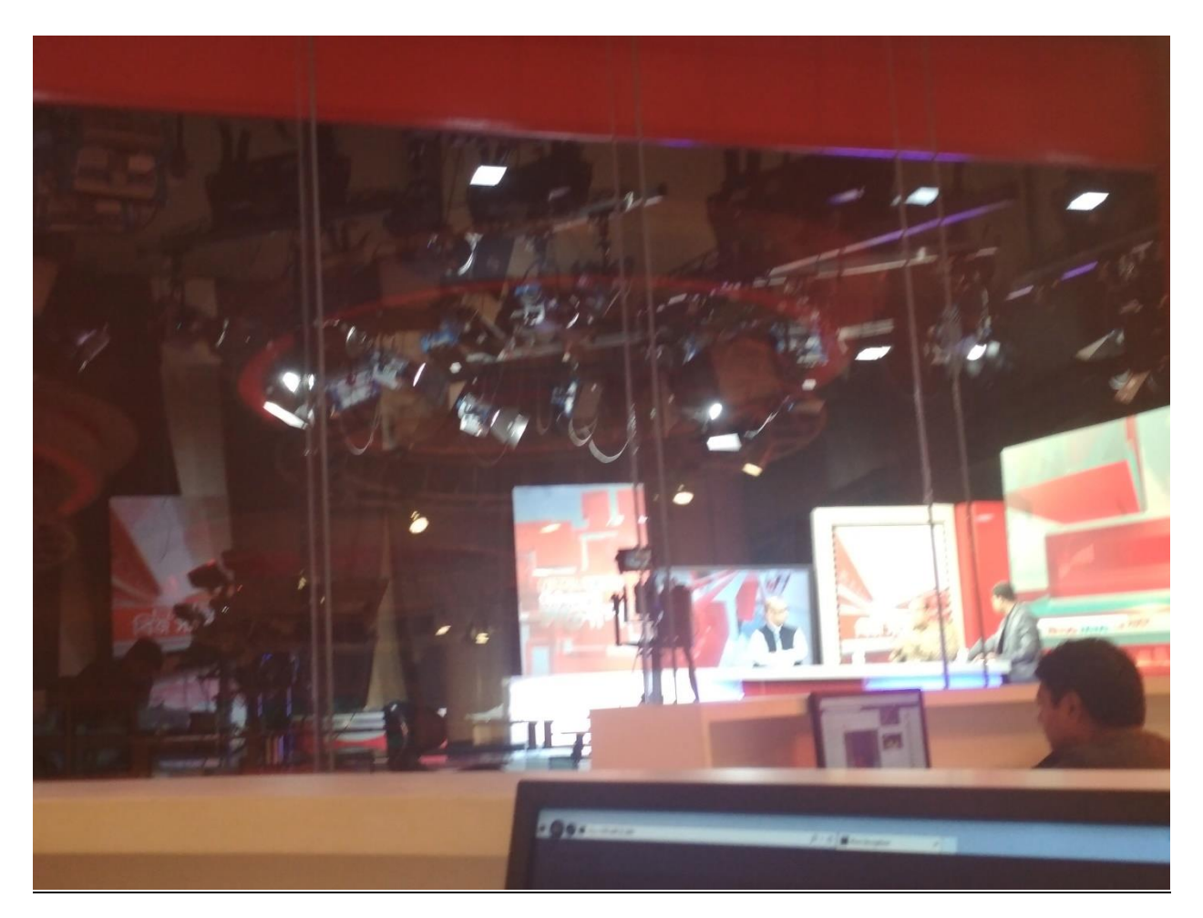
World class technological equipment's.