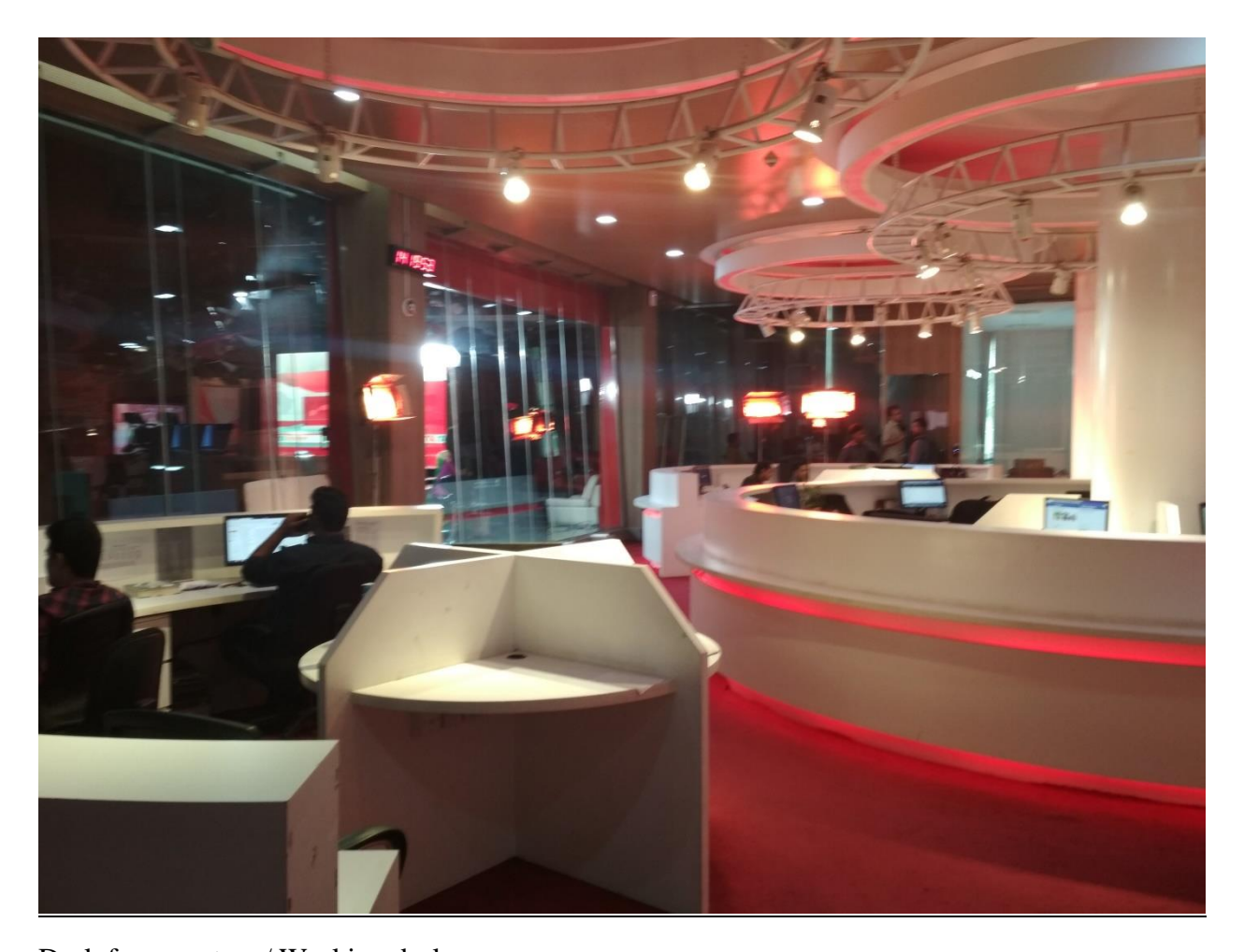
Desk for reporters / Working desk.