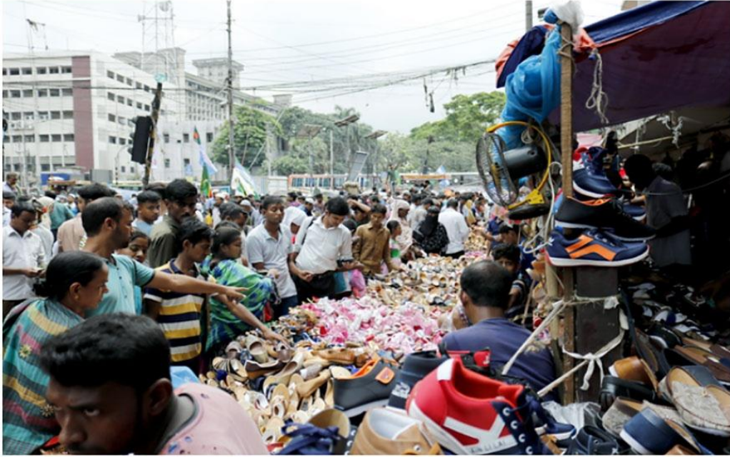
ঈদের কেনাকাটায় ব্যস্ত রাজধানীর ফুটপাথলোর একাংশ

সাধ আছে সাধ্য নেই। এই সাধ্যের মধ্যে ঈদের কেনা কাটার আনন্দটুকু খুঁজে নিতে রাজধানীর বিভিন্ন ফুটপাথে ভিড় জমাচ্ছে নিম্নআয়ের মানুষগুলো। শীতাতপ নিয়ন্ত্রিত বিলাসবহুল মার্কেটগুলোর দামের তেজে নিম্নআয়ের মানুষগুলো দাঁড়িয়েছেন ফুটপাথের ঈদ বাজারে। শরীরে কোমল ঠাণ্ডা বাতাসের পরশ নিয়ে যখন বড় বড় বিপণিবিতানগুলোতে উচ্চবিত্তরা ঈদের বাজার করছে, তখন সড়কের পাশের ফুটপাথে দোকানগুলোতে সাধ্যের মধ্যে গরীবের পোশাকের চাহিদা মেটাচ্ছে।