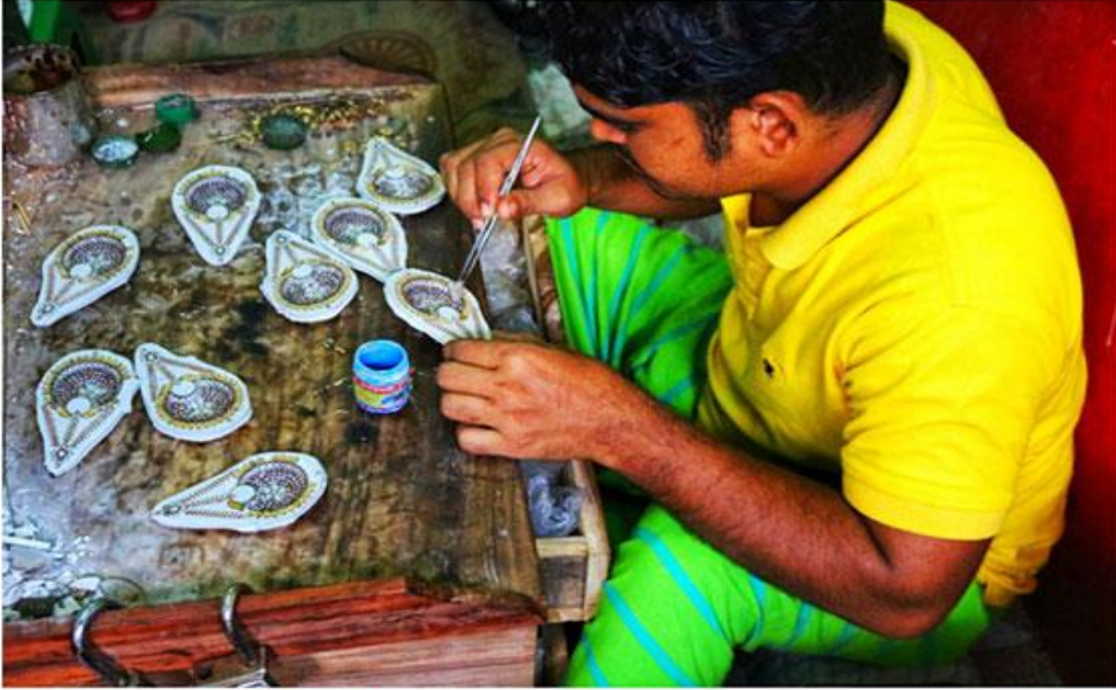
ভাকুর্তায় গহনা তৈরিতে ব্যস্ত এক কারিগর।

নারীদের শোভা বর্ধনে গহনার কোন জুড়ি নেই নারীর রূপের আরেক চমক হল গহনা। এই গহনার কদর সব ছেয়ে বেশি নারীদের কাছে। সোনার কদর নারীর কাছে অনেক আর এই আকাশ চোয়া দামের কারণে তারা এখন জুগছে এমিটেশন গহনার দিকে। আর এই ইমিটেশন গহনার সিংহভাগ আসে রাজধানীর মোহাম্মদপুর, আদাবর আর বেড়িবাঁধ এলাকার ঠিক উল্টো দিকেই তুরাগ নদী পেরিয়ে জনপদ ভাকুর্তা থেকে। সাভার উপজেলার এই ইউনিয়নে রয়েছে ৩৬টি গ্রাম। এসব গ্রামের সর্বত্র গহনা তৈরির দৃশ্য চোখে পড়বে।